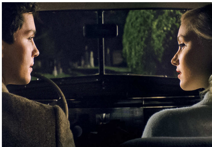
Logan Lerman, Sarah Gadon

Das Regiedebüt von James Schamus, einem der wichtigsten unabhängigen Filmproduzenten der USA, basiert auf dem gleichnamigen Roman von Philip Roth. Schon in seinen Produktionen zeigte Schamus einen besonderen Sinn für sogenannte Außenseiter, die versuchen, sich gesellschaftlichen Strukturen zu widersetzen. In INDIGNATION werden die Gespräche mit dem Dekan zu Rededuellen, in denen ein junger Mann seine moralischen und politischen Ideale selbstbewusst vertritt. Doch kann er sie auch leben?