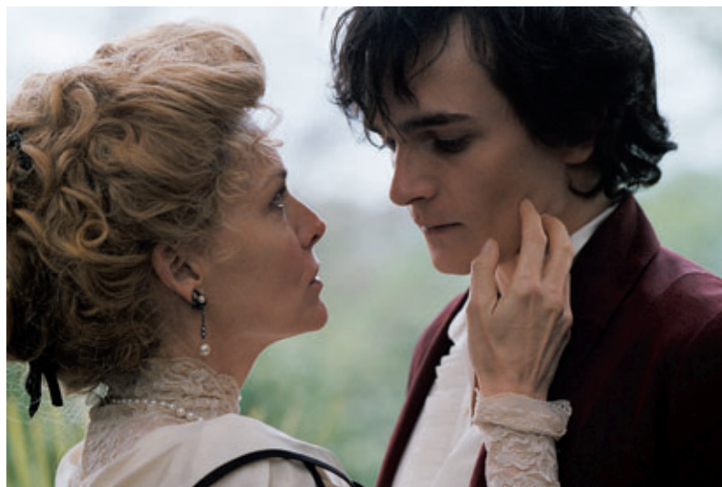
Michelle Pfeiffer, Rupert Friend

Weltvertrieb Pathé International Kent House, Market Place GB-London W1W 8AR Tel.: +44 207 3235151 sales@patheinternational.com